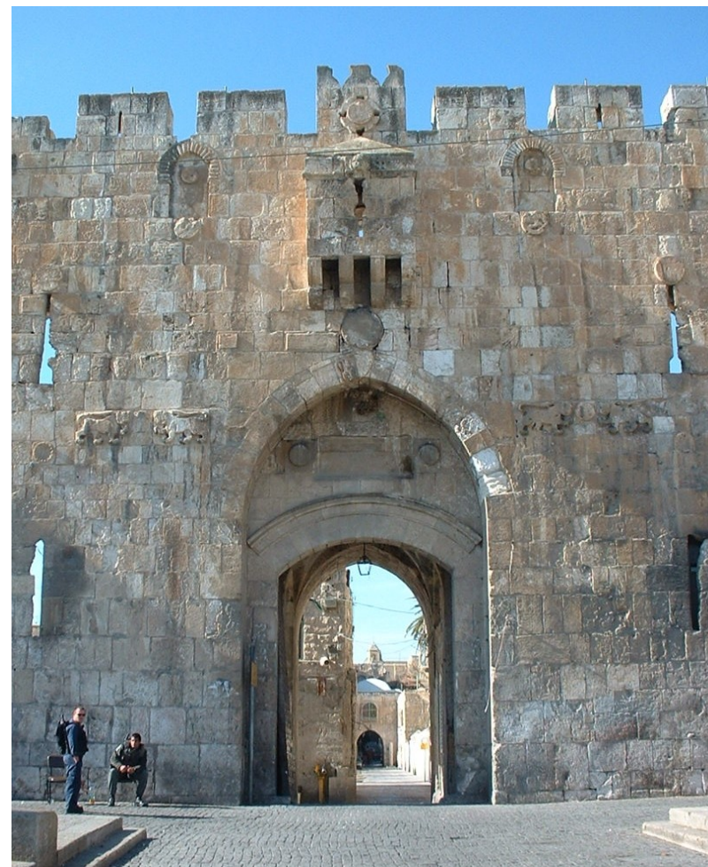
羊门、狮子门、司提反门